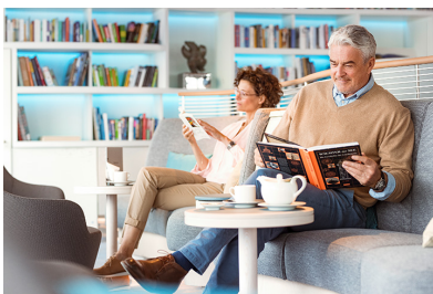
Tag 21-22: Seetage Fahrt durch die Drake Passage.