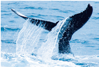
Tag 10: Seetag Entspannung auf See.