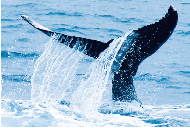
Tag 10: Seetag Entspannung auf See.