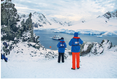
Tag 11-20: Süd-Orkney-Inseln , Süd-Shetland-Inseln , Weddellmeer intensiv , Antarktische Halbinsel